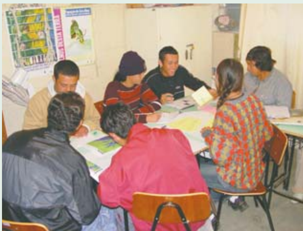
Moradores da Ilha das Peças estão participando de oficinas de capacitação em ecoturismo

Em agosto deste ano, aconteceu na Ilha das Peças a primeira de um série de oficinas de formação. A segunda foi realizada em outubro. “As oficinas de capacitação pretendem aperfeiçoar o atendimento aos visitantes e, desse modo, incrementar a renda da comunidade local”, explica o enge-