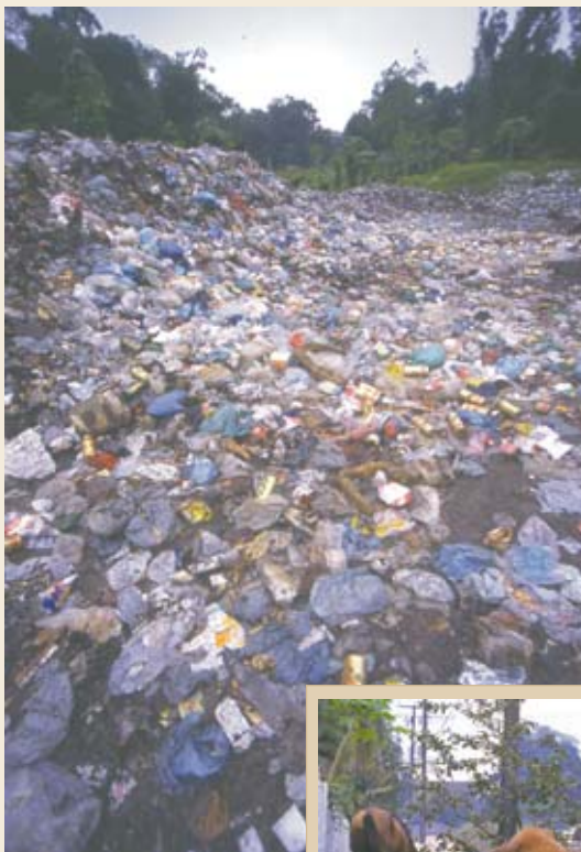
A situação do lixão de Guaraqueçaba impressionou os estudantes

Outra surpresa para os alunos foi a grande quantidade de animais, como cães e cavalos, soltos pelas ruas, o que os levou a propor a criação de um espaço para abrigá-los. Quanto ao problema do lixão, a sugestão foi o uso de incinerador para queimar os resíduos hospitalares.