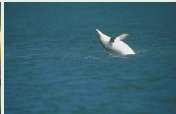
O IPÊ concentra seus esforços na conservação do mico-leão-da-cara-preta e o IPEC desenvolve pesquisas com o boto cinza. Ambas as espécies vivem no entorno do Parque Nacional