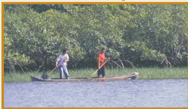
Moradores das comunidades fazem parte do grupo de conselheiros

A segunda reunião do grupo aconteceu no último mês de agosto