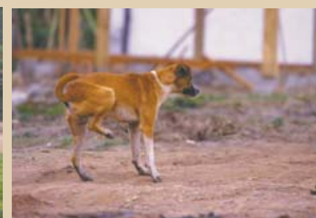
Os alunos propuseram a criação de um espaço para abrigar os animais que se encontram soltos pelas ruas do município