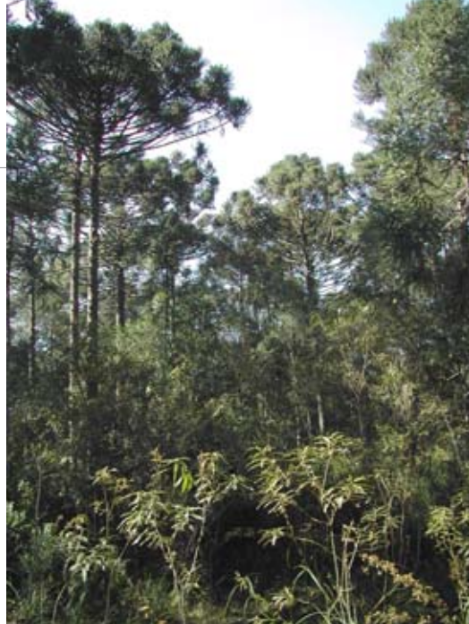
Área em regeneração no Sítios das Araucárias, em Fernandes Pinheiro (PR): área integra o Programa de Adoção de Floresta com Araucária