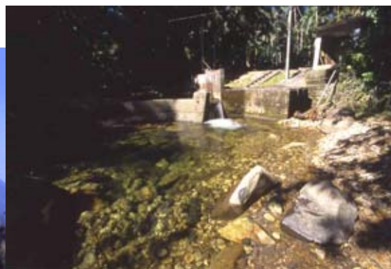
Reserva Natural Morro da Mina: captação de água para população de Antonina é feita nesta reserva de 3.300 hectares