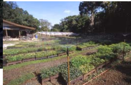
Com capacidade de produzir até 300 mil mudas por ano, viveiro da SPVS trabalha com até 40 espécies de árvores nativas da Floresta Atlântica

Diagramação: Celso Arimatéia