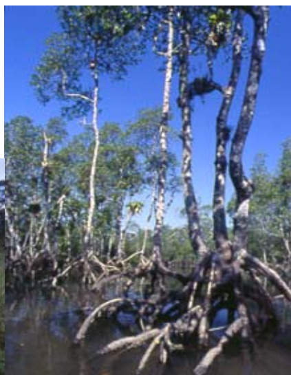
Manguezal na Reserva Natural Serra do Itaqui: os 7 mil hectares da reserva mantida pela SPVS tem variada composição de ecossistemas